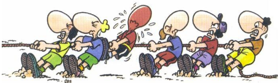
Wir ziehen am gleichen Strick!